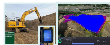
ICT建機・プラットフォーム進捗管理