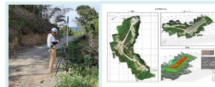
GNSS・UAV測量による3次元化