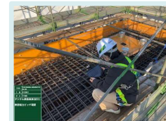
デジタル鉄筋計測